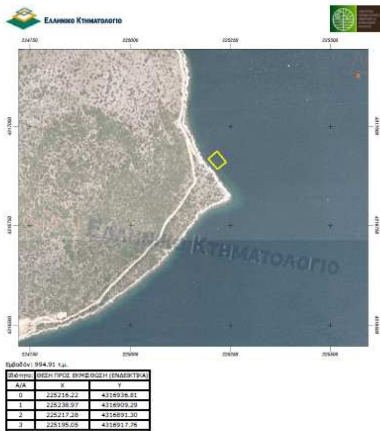
Β: Απόσπασμα χάρτου από το Ελληνικό Κτηματολόγιο στον οποίο φαίνεται ενδεικτικά η θέση προς εκμίσθωση στον κάβο Λασκάρας ΠΕ Πρέβεζας